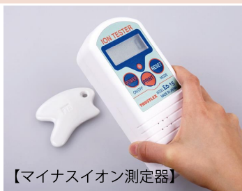
【マイナスイオン測定器】